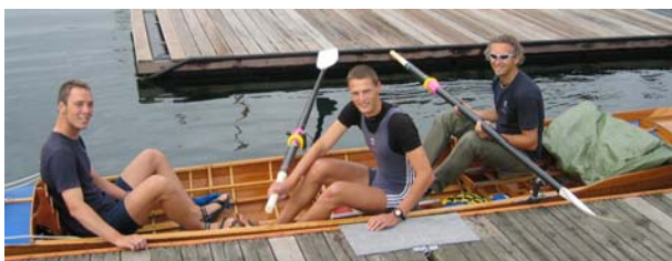
Båden er pakket - Klar til afgang

Vi mødtes i klubben kl. 7.30 og pakkede båden. Vi stævnede ud fra klubben kl. 9.40 og lagde kursen mod pynten.