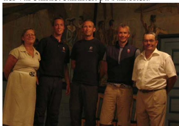
NSR - I selskab med formand og kone

Vi var bange for, vi kom for sent, men vi kunne se folk på balkonen - som vi nærmede os stimlede der flere til. Vi gled stille gennem det blanke mørke vand og 15 m. før pontonen rejste vi åren, hvilket udløste et stort bifald fra festdeltagerne, der var stimlet sammen på balkonen.